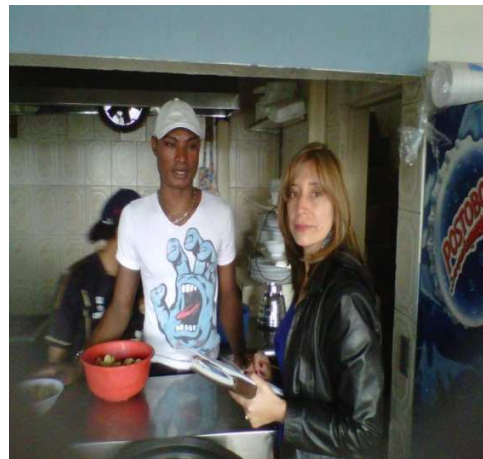
Restaurante Coma Tú. Calle 17ª No. 102 – 83. Localidad de Fontibón