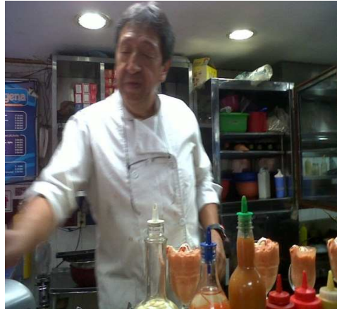
Restaurante Maria del Mar Av 19 No. 5-93. Localidad de Santa Fé