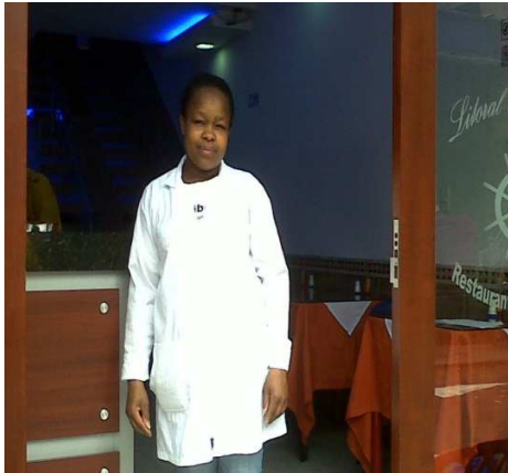
Restaurante Litoral del Pacífico Cra 4 No. 20-41. Localidad de Santa Fé.